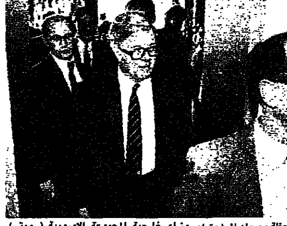
الوزير جيري هو لحظة وصوله الى اجتماع وزراء خارجية المجموعة الأوروبية